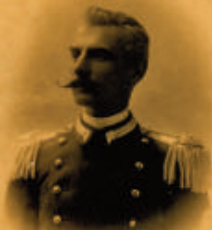
al. Franc. Ayo Bigonini L'off: 1 o colonnello J. Vandro