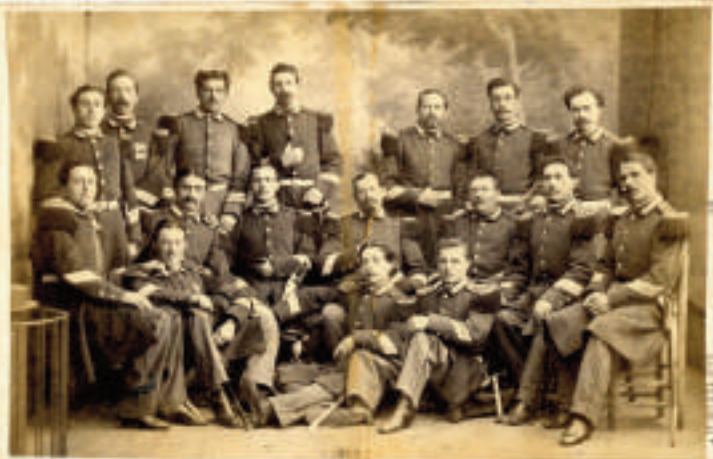
1864 - 1865 The 1st Regiment of Cavalry of the 1st Cavalry Division of the 1st Cavalry Division of the 1st Cavalry Division